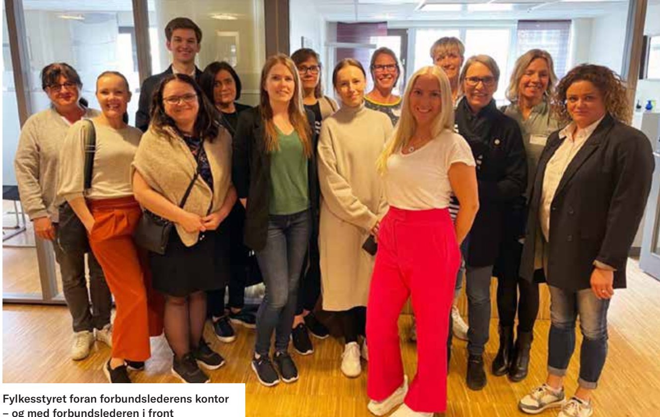
Fylkesstyret foran forbundslederens kontor – og med forbundslederen i front