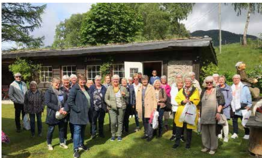
Onsdag 1. juni er 31 sykepleie pensjonister klar for spennende tur til Ryfylke.