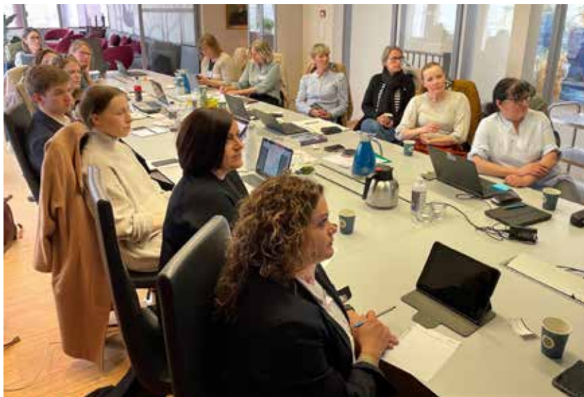
Engasjerte, lyttende og lærevillige fylkesstyremedlemmer.