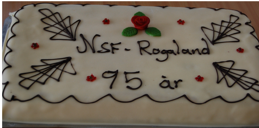
Bursdagskake må en jublant ha!

Klart det må bli både ballonger, kaker, stortingsrepresentant og 2. nestleder av slikt. For ikke å glemme alle de flotte medlemmene som bidro til en kjempekjekk kveld på Tysværtunet!