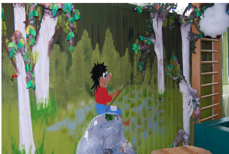
Sanserommet - flott utsmykking!